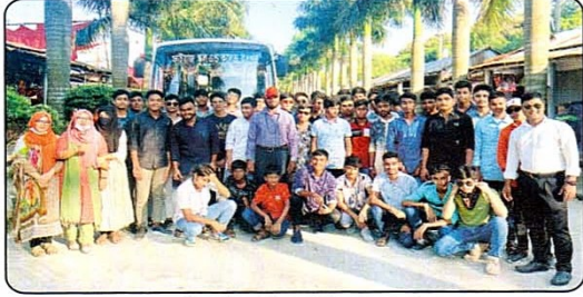
আবাসিক শিক্ষার্থীদের “দ্বি-মাসিক” শিক্ষা সফর