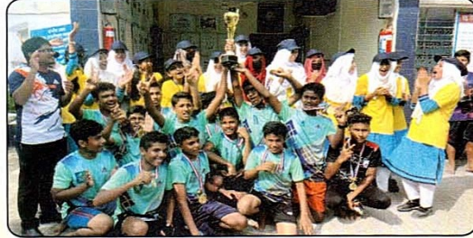
“ফুটবল টুর্নামেন্ট ২০২২” এর চ্যাম্পিয়ন দল

দৃষ্টি আকর্ষণঃ আল-ফাইয়াজ আলিয়া মাদ্রাসা, রংপুর এ শিও শ্রেণি হইতে ৮ম শ্রেণি পর্যন্ত ছাত্র-ছাত্রী ভর্তি চলছে। উল্লেখ্য যে, এখানে নূরানী, নাজেরা ও হিফজ বিভাগ চালু আছে।